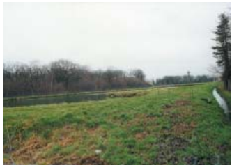
Station par lagunage de Jouy-le-Potier

Le dos de la station d'épuration par lagunage de Jouy-Le-Potier s'intègre parfaitement dans un paysage de Sologne, avec sa forêt et ses étangs. Mais son entrée présente au public un vaste espace résiduel, un grillage tenu par des poteaux en ciment, un portail rouillé... Cette entrée gâche les atouts d'intégration des bassins de lagunage dans ce paysage.