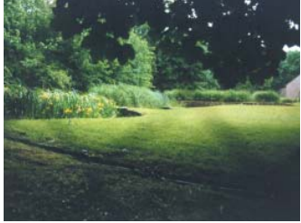
Station de St-Bohaire, Loir-et-Cher