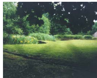
Station de Saint-Bohaire, Loiret-et-Cher

Textes, croquis, photos : Élise Boissay, paysagiste DPLG.